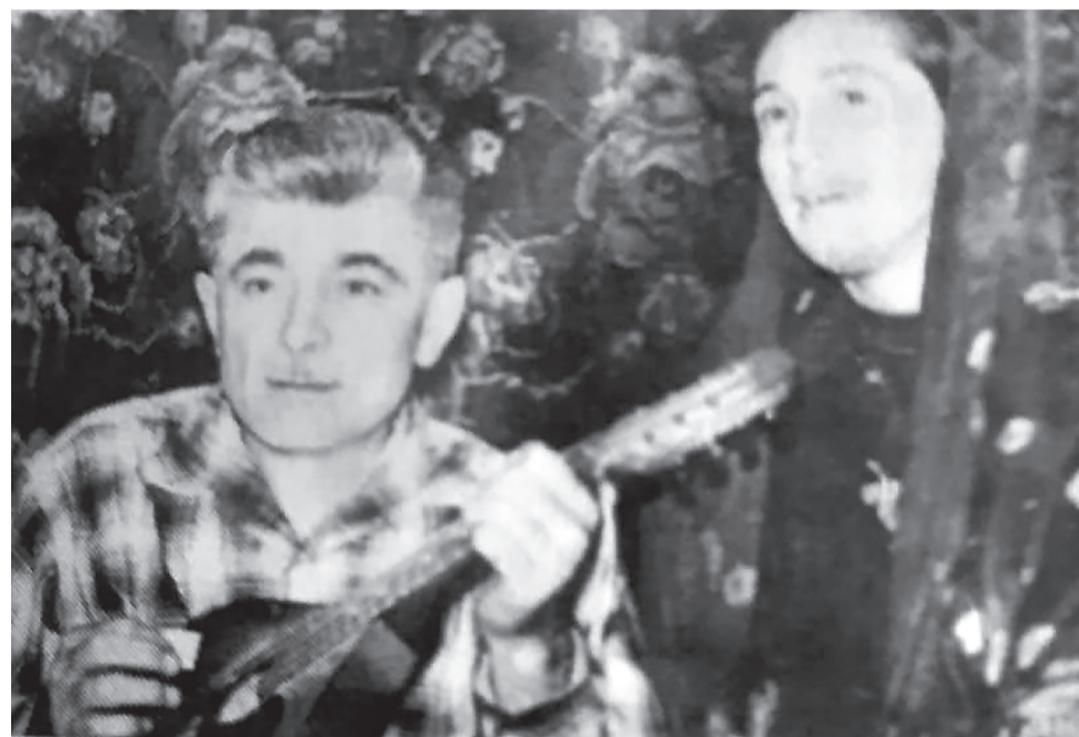
КечІ ахІулел буго ГІайшат Мазаловалъ

- Инсул кумекалдалгун ккана дирги АхІмадилги лъай-хъвай. Гъеб букІана 1959 сон. АхІмад хІалтІулев вукІана районоялда бетІерав бухгалтерлъун. Анкъабилеб классалъ-