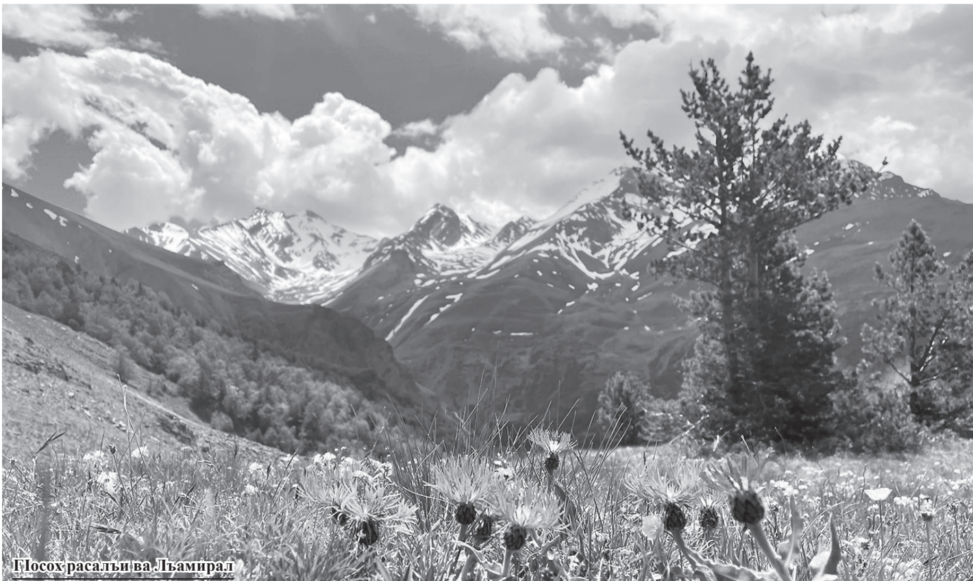
ГІосох расалъи ва Лъамирал

МугІрузул къимат гъабулел бугищ? Чорок гъарулел лъарал, гІорал, роцноца рацарал хІухъбахъиялъул бакІал. Гъеб цоги суал буго къойил бицине ккараб.