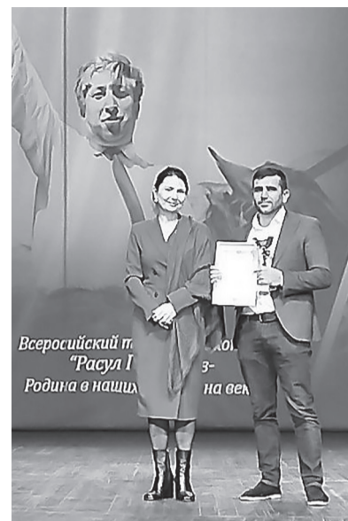
Всероссийский п. «Расул Г. Родина в наших

Баркула маӀарулазул матӀу - «ХӀакъикъат» газеталъул бергъенлъаби!