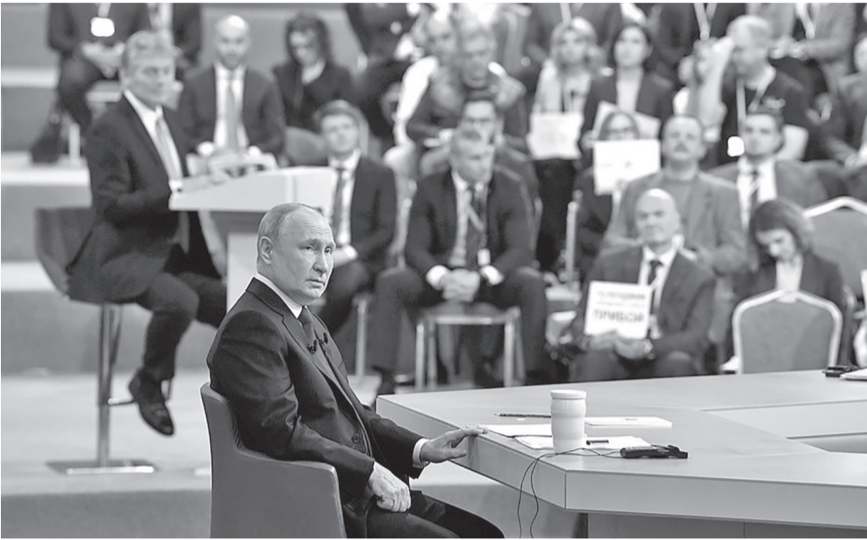
(Байбихъи І-себ гьумералда)

- Россиялъул БахІарзазе шапакъатал къуна. СВОялда бугеб хІалалъе кинаб къимат къолеб? Масъалабиги мурадалги долго ругищ? Кида лъугІизе бугеб гъеб рагъ?