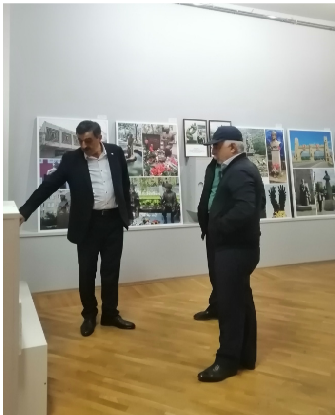
ГI. МухIамадовас жиндирго хIалтIабазул бицунел буго

Данделъи рагъулаго, Россиялъул Художниказул союзалъул Дагъистаналда бугеб отделениялъул председатель, художник-ювелир, Россиялъул художествабазул академиялъул член-корреспондент КъурбанГали МухIамадовас абуна: «Художниказул союзалъул бергъенлъаби - гъеб ккола щивав художникасул бажари ва мащел. Нилъеда бихъулеб буго кинаб хатI, лъалкI художниказ толеб бугебали суратал рахъиялъул, рукIа-рахъиналъул тIагIалаби гъариялъул искусстволъул, халкъияб творчество цебетIезабиялъул».