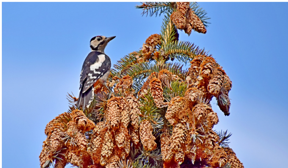
(Байбихи 44-аб. номералда)

Цо дагъаб добеган нижеда гьотлода гьоркь наккил багачазул гохи батана.