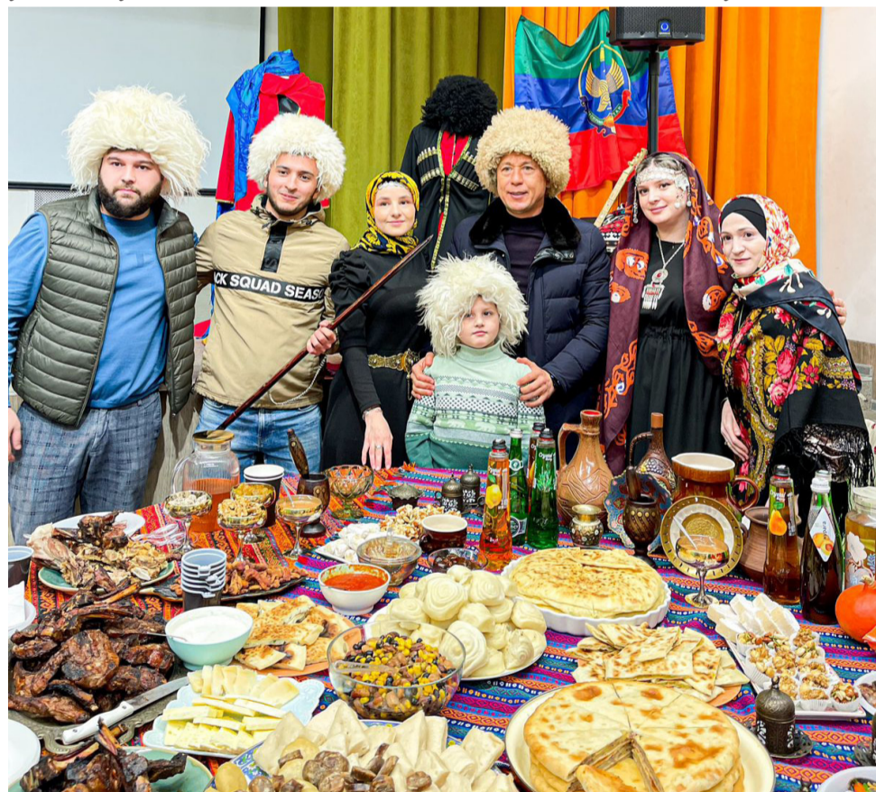
Халкъал цольиялълул къоялълул байрам. Дагъистаниялги бакълъл Нижнекамск шагъаралълул мэрги.

- Хлалтиги шолаан, гъанжеги швелаан. Гъанже дун гъаний ругълъана. Школадде васги уна, гъаб шагъарги дие глагарабълун лъугъана. Ватаналдаса хирияб жо буклиноро, гъение ячине дица хларакатги бахъула. Исана ункъо нухалда швана Дагъистаналде. Цониги руссен-сверри бугони, гьеб гьоркъоб биччазеги бокълуларо. Цо-киго анкълъ цеги швана дун гъение берталъе, цадахъ гъаниса ясалгицин руклана. Нижерго районалде, росулъе, магларухъе швезе цакъ бокълула. Авар театралде, магларулал ругел кинаб батаниги данделъиялде ине бокълула.